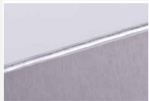
Részlet a tűzőhegesztésből. Észrevehető a felület kiváló minősége és a kimagasló hegesztési pontosság